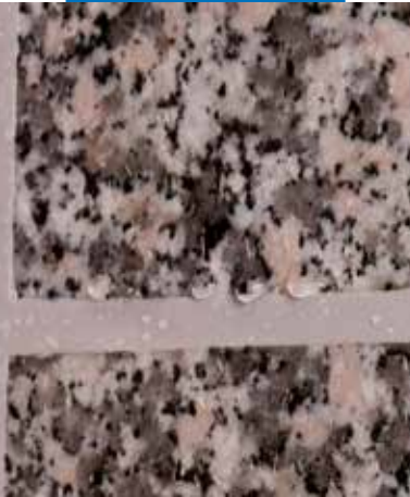
Schließen einer Bewegungsfuge im Natursteinbelag