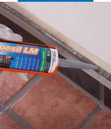
Schließen einer Anschlussfuge

Mapesil LM zeichnet sich durch ein sehr breites Haftspektrum auf vielen am Bau verwendeten Materialien (Glas, Keramik, Marmor, Aluminium, verzinktes Stahlblech, Beton, Edelstahl und PVC), auch ohne Verwendung eines Primers, aus.