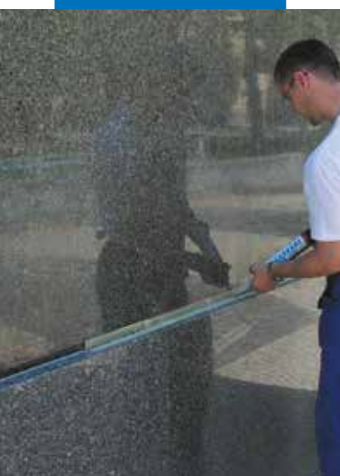
Natursteinverfugung einer Fassade mit Mapesil LM

Alle relevanten Referenzen zum Produkt sind auf Anfrage oder im Internet unter www.mapei.com erhältlich